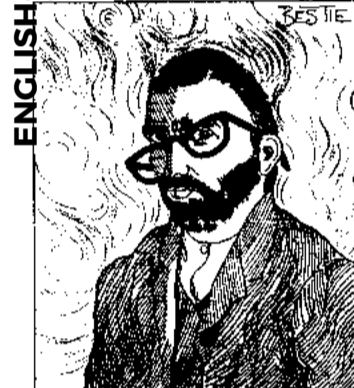
LIFE BECAME DIFFICULT FOR VAN GOGH AFTER HE CUT HIS EAR OFF.